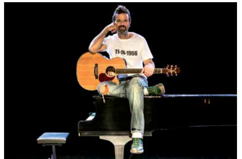
Banda JARABE DE PALO

Muchas gracias por haberme/nos acompañado durante todos estos años, y que por muchos más nos podamos seguir compartiendo.